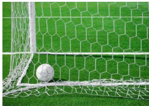
«Забей гол в ворота»

Вырезать из тонкой бумаги листочек (бабочку, лягушку, снежинку и т.д.), положить на ладонь ребёнка. прямая ладонь поднята на уровень рта: расстояние от губ 10 -15 см. плавно выдыхая через «хоботок» сдуть листок с ладони.